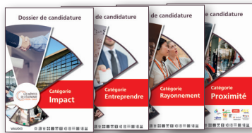
Dossiers de candidature des 4 Mérites

Au terme du délai de candidature, fixé le 30 avril 2020, les dossiers seront soumis à deux jurys distincts. En parallèle, deux comités experts parcourront l'ensemble des dossiers reçus afin de distinguer une entreprise dans le domaine du développement durable ainsi qu'une femme dirigeante/entrepreneuse :