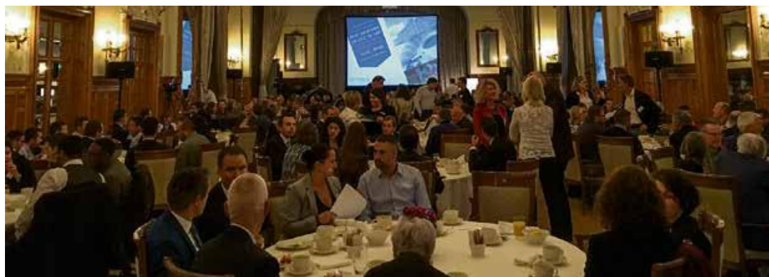
Le petit déjeuner de l'économie, un moment de réseautage.